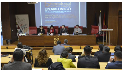
Imaxe da inauguración.