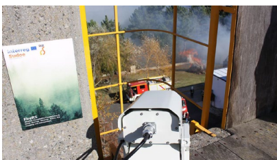
Comprobouse o funcionamento dos sensores infravermellos de terra, que detectan focos de calor.