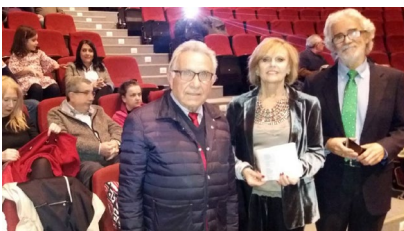
Parte da promoción homenaxeada.

Cando está a piques de comezar o mes de decembro, a Vicerreitoría do Campus de Ourense volve un ano máis a pór en marcha a recollida solidaria de alimentos, xoguetes e libros para axudar ás familias máis necesitadas a ter un mellor Nadal. Ata o día 14 de decembro, os membros da comunidade universitaria poden deixar as súas doazóns nos espazos habilitados á entrada de cada edificio universitario. +Info.