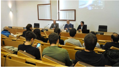
O día 29 celébrase o New Space España, organizado por Universidade, Cinae e Alén Space.