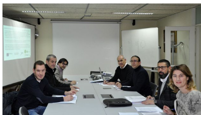
O obxectivo é procesamento en tempo real da información procedente da monitorización e simulación das instalacións.

Un total de nove conferencias porán o foco este sábado na Escola de Enxeñaría Forestal en diversos aspectos relacionados coa conservación e protección da biodiversidade, desde a polinización ou a recuperación de solos aos plans de conservación de especies ameazadas, no marco das II Xornadas Galegas de Patrimonio Natural e Biodiversidade , que a Sociedade Galega de Historia Natural (SGHN) promove coa colaboración da EE Forestal. +Info.