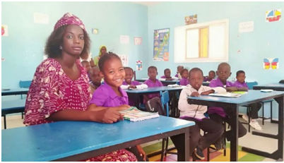
Imaxe da escola Arco Iris.