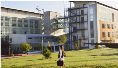
Será na Facultade de Dereito.