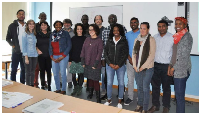
Foto de familia das e dos participantes do curso de formación.