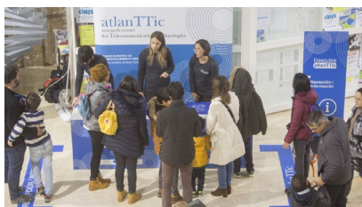
Intre dalguns asistentes na recepción.

A Cátedra Internacional José Saramago continúa programando actividades culturais e divulgativas para fomentar o coñecemento sobre a figura do Nobel portugués entre a cidadanía. Desta volta, será o profesor e investigador Carlos Salzani o encargado de ofrecer un relatorio para afondar na relación de Saramago coa filosofía, que terá lugar o vindeiro día 14 de novembro ás 19.00 horas no Centro Cultural do Instituto Camões. +Info.