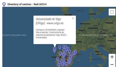
Convértese na segunda institución en Galicia en ser incluídas na RED UCC+i.