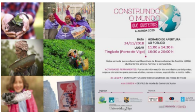
Cartel das xornadas.

Dar a coñecer á cidadanía os obxectivos de desenvolvemento sostible da Axenda 2030 a través de xogos cooperativos, obradoiros, exposicións, contacontos e un desfile de moda, é a finalidade da xornada Construíndo o mundo que queremos . A Axenda 2030 que se celebrará o sábado 24 de novembro no Tinglado do porto de Vigo. A iniciativa da Universidade de Vigo, a Rede Social Galicia Sur, a campaña Impórtanos, a Coordinadora Galega de ONGD desenvolverase entre as 11.00 e as 14.30 da mañá e de 16.30 a 20.00 horas, centrándose en tres grandes bloques: persoas, planeta e prosperidade, a través de actividades dirixidas a persoas de todas as idades. +Info.