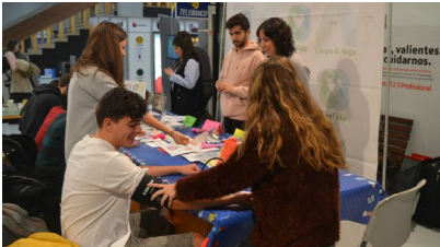
CCSS e da Comunicación acolleu unha nova sesión dos Martes Saudables.