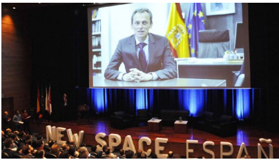
O evento comezou cunha mensaxe do ministro Pedro Duque.