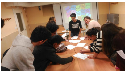
Imaxe do obradoiro.

Nos últimos anos as competencias transversais estanse consolidando como unha formación, non só importante, senón fundamental e necesaria para o alumnado dos graos. Por este motivo, as universidades están cada vez máis implicadas en deseñar programas formativos que redunden na adquisición deste tipo de características por parte do alumnado. Tanto é así que algúns plans de estudo dos graos xa inclúen este tipo de contidos e cada vez son máis os docentes que apostan por achegar ao seu estudantado coñecementos relacionados coa toma de decisións, comunicación, xestión do tempo, organización ou traballo en equipo. +Info.