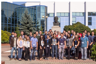
Integrantes da rede Nanouptake nunha xuntanza celebrada recentemente em Polonia.

Froito da colaboración entre a Universidade de Vigo, o Consello Social da Universidade de Vigo e a Deputación de Ourense e co obxectivo de fomentar a internacionalización do campus de Ourense cada ano convócanse as Bolsas Ourense Exterior. Este curso académico son tres as e os estudantes de mestrado, procedentes de Brasil, Colombia e Uruguai, que xa están no campus grazas a esta iniciativa, cuxo beneficiarios teñen de balde as taxas de matrícula e reciben unha axuda de 3100 euros para gastos de viaxe e aloxamento. +Info.